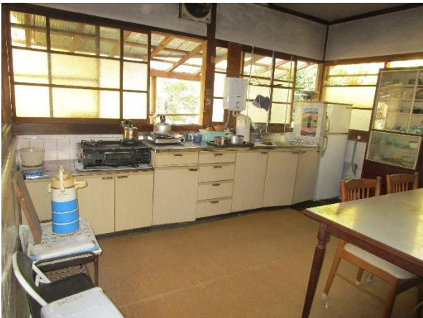
別棟 ダイニングキッチン