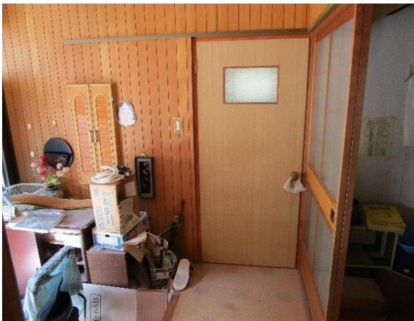
洗面所・トイレ・お風呂場 入口